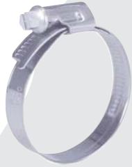
ABRAZADERA TORRO C7 W1 NORMA