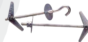
PALOMILLA TECHO ESPIGA/GANCHO